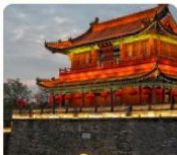
เมืองโบราณจิงโจว