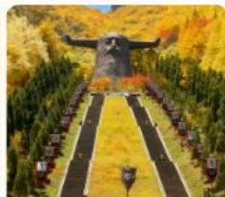
อุทยานเสินหลงเจีย