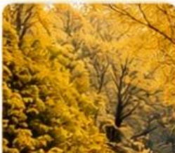
หุบเขาแปะก๊วย