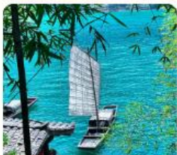
หมู่บ้านซานเซี่ย