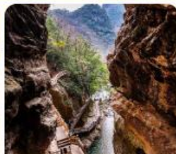
สะพานเทียนเซิง