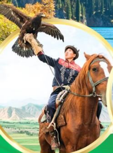
ชมโซว์นคอินทรีย์