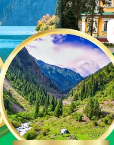
Ala Archa National Park