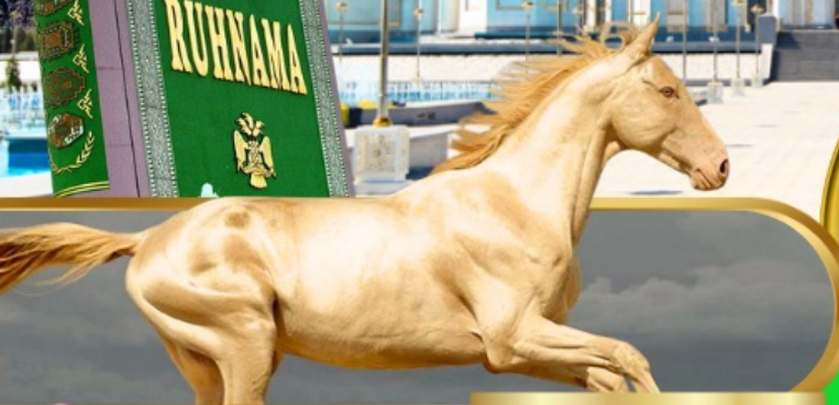
Akhal Teke Horse