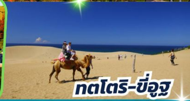
ทตโตริ-ซ็องจู