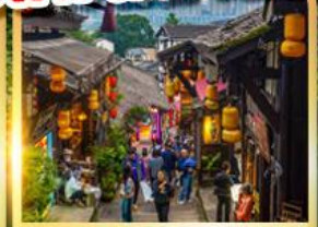
หมู่บ้านโบราณเฉิงชิว