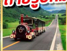
อุทยานนางฟ้า