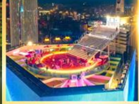
จุดชมวิวจางชิ่งเวิลด์เทรด 131