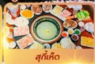
สุกั้เห็ด