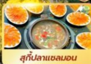
สุกี่ปลาเซลมอน