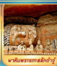
พาคืนพระแกะสลักต้าจู่