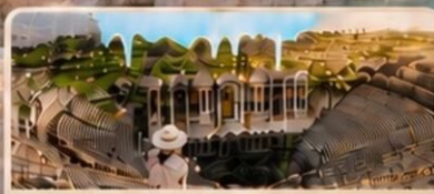
เมืองเซียร์าโพลิส