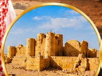
กลุ่มปราสาททะเลทราย (Desert Castles)