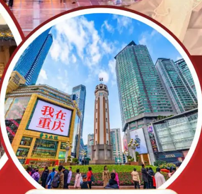
ถนนคนเดินเจี่ยฟางเป่ย์