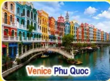
Venice Phu Quoc