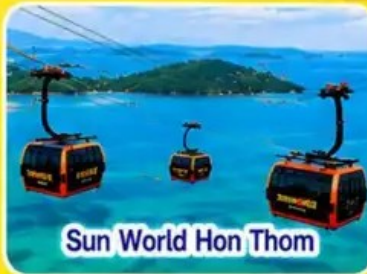
Sun World Hon Thom