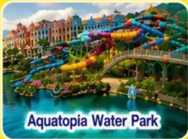
Aquatopia Water Park