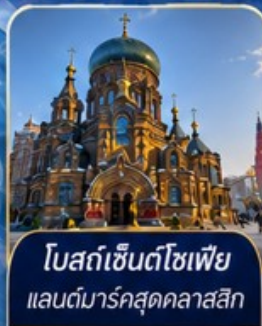
โบสถ์เซนต์โซเฟีย แลนด์มาร์คสุดคลาสสิก