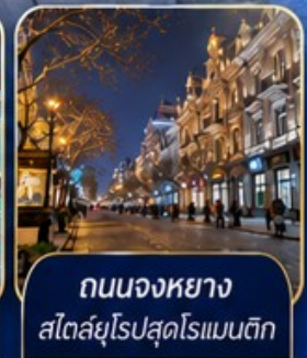
ถนนจงหยาง สไตล์ยุโรปสุดโรแมนติก