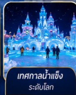
เทศกาลน้ำแข็ง ระดับโลก