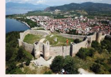
St. John at Kaneo Church บ่อมปราการซามูเอล

** พักที่ Hotel Holiday Inn 4* หรือเทียบเท่า **