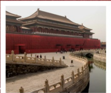
พระราชวังต้องห้ามกรุงปักกิ่ง