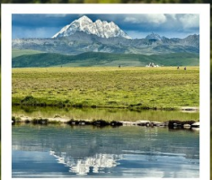
ดวงตาแห่งถ้ำกวง

หมู่บ้านทิเบตเจียงจวี • จุดชมวิวกูซาหิมะหยาหลา • ปาเหม่ย์ สวนหินปาเหม่ย์ • จุดชมวิวดวงตาแห่งถ้ำกวง • วัดมู่หย่า หมู่บ้านเกอริ้อูหม่าซุน • ซินตูเจียง • หมู่บ้านกุน่งซุน หมู่บ้านปาหลางเจียงตู • เมืองลอยฟ้าเกอเตี๋ลามู่ • ภูเขาจ้อตั่วซัน ถนนสายรุ้ง • ทะเลสาบแดง • ถนนคนเดินชอยกวางแคบ