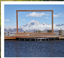
ปาหลางเจียงตู