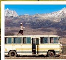
เมืองลอยฟ้าเกอเตี๋ลามู่

ทัวร์คุณธรรม ไม่ลงร้านช้อปปิ้ง ไม่ขายออฟชั่น