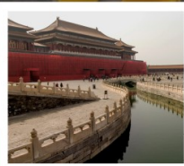
พระราชวังกู่กง