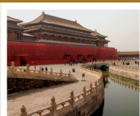
พระราชวังปักกิ่ง