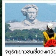
จัตุรัสยาวขนเซี่ยงเสวีย