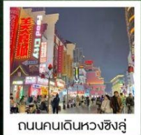
ถนนคนเดินหวงชิ่งอู่