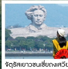
จัตุรัสยาวขนเซี่ยงกงเสวีย