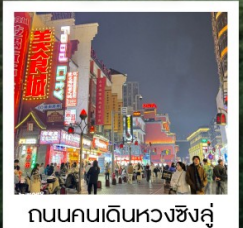
ถนนคนเดินหวงซิงลู่

ถนนคนเดินเต้าฮิวเหอเจีย • น้ำตกฟูหรง (รวมค่าช่างถ่ายรูปกับวิวน้ำตกท่าละ 1 รูป) • ชมบรรยากาศยามค่ำคืนเมืองโบราณฟูหรงเจี้ยน ดวงตาแห่งเฟิ่งหวง • หอคอยประตูเมืองตะวันตก • Bar Street • เมืองโบราณเฟิ่งหวง • สะพานสายรุ้ง ล่องเรือตามลำน้ำถั่วเจียง ชมเมืองโบราณเฟิ่งหวงยามค่ำคืน • อำเภอเจียงโข่ว • เขาฟ่านจิ้งซาน (รวมกระเช้าขึ้น-ลง+รถอุทยาน) หงอวันจินตัง • เสาคินเห็ด • เมืองถงเหริน • จัตุรัสยาวขนเซี่ยงกงเสวีย • วัดโคฟู่ • ถนนหวงซิงลู่ • อีระช้อปปีงเอ้าท์เล็ทฉางซา