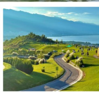
ภูเขาอวิ้นเซียงซาน