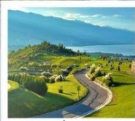
กุขาววินเซียงซาน