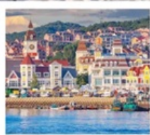
ท่าเรือประมงเขียนโก๋

เรือลิวส์ / ย่านฮั่นเล่อฟาง / ถนนฮั่วจวิปา ท่าเรือประมงเขียนโก๋ / ย่านฮงโหว่ 1920 / ถนนโบราณเฉาหยาง หอคอยกาลเวลา / ชายหาดจินซา / รูปปั้นปลาวาฬ / หาดทรายซาจื่อโหว่ หาดไซเบอร์ NO.3 / โรงงานเบียร์ชิงเต่า / โบสถ์ St. Emil ถนนคนเดินไต้ตง / สะพานจันเฉียว / จัตุรัส 54 / ห้าง MIXC