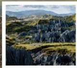
สวนหินปาเหมย์