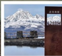
ปาหลางเจียงตู