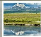
ดวงตาแห่งถ้ำกวาง