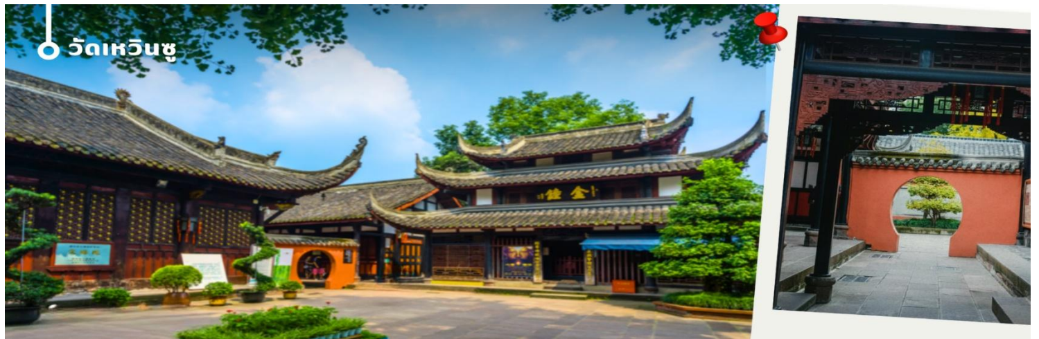
วัดเหวินชฺู

หลังรับประทานอาหารเช้า นำท่านเดินทางสู่ วัดเหวินชฺู หรือที่รู้จักกันในชื่อ “พระอารามสง่างาม” เป็นวัดพุทธในเมืองเฉิงตูที่อนุรักษ์ไว้ได้อย่างสมบูรณ์ที่สุด มีทิศหน้าไปทางทิศเหนือและใต้ สถาปัตยกรรมแบบดั้งเดิมของที่ราบสูงตะวันตกเฉียงใต้ของจีน สร้างด้วยไม้ อาคารหกชั้นเป็นตัวอย่างของสถาปัตยกรรมสมัยราชวงศ์ซิง การออกแบบของวัดเหวินชฺูมีแกนกลางคือแนวกลางที่เป็นแกนหลัก สไตล์การก่อสร้างหลักคือหลังคาทรงจีนและหลังคาทรงไทย การจัดวางอาคารยึดตามระดับชั้นและฐานะอย่างเคร่งครัด สะท้อนให้เห็นถึงการจำกัดทางพิธีกรรม วัดเหวินชฺูเป็นสถานที่ศักดิ์สิทธิ์ที่รวมพระอารามศักดิ์สิทธิ์, สถาปัตยกรรมสวนโบราณ, การเคารพสักการะ, และการศึกษาทางศาสนาไว้ด้วยกัน