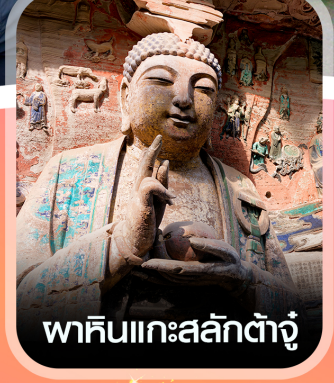
พาคินแคะสลักตัวจู้