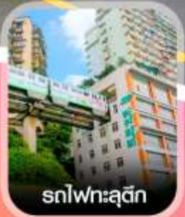
รถไฟทะเลตุ๊ก

✈️ คอนเฟิร์มออกเดินทาง ทุกพีเรียด 2 ท่านขึ้นไป