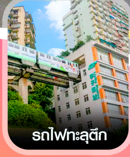
รถไฟทะเลตุ๊ก

✈️ คอนเฟิร์มออกเดินทาง ทุกพีเรียด 2 ท่านขึ้นไป