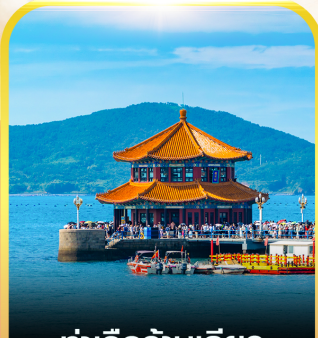
ท่าเรือจันทิว