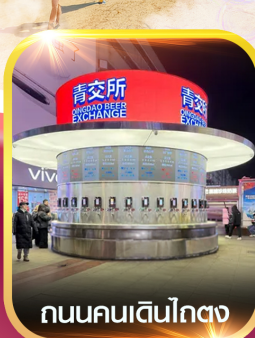
ถนนคนเดินโกตง