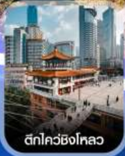
ตึกไควซิงโหลว

✈️ คอนเฟิร์มออกเดินทาง ทุกพีเรียด 2 ท่านขึ้นไป