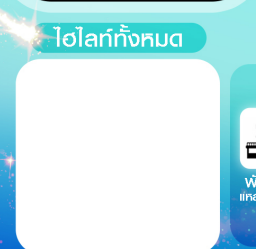
ไอโวกะกิงคุมต