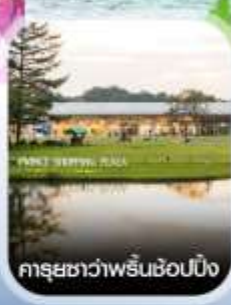
คารุยชาว่าพรีนช้อปปี้ง