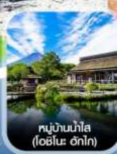
หมู่บ้านน้ำใส (โอชิโนะ ฮักไก)