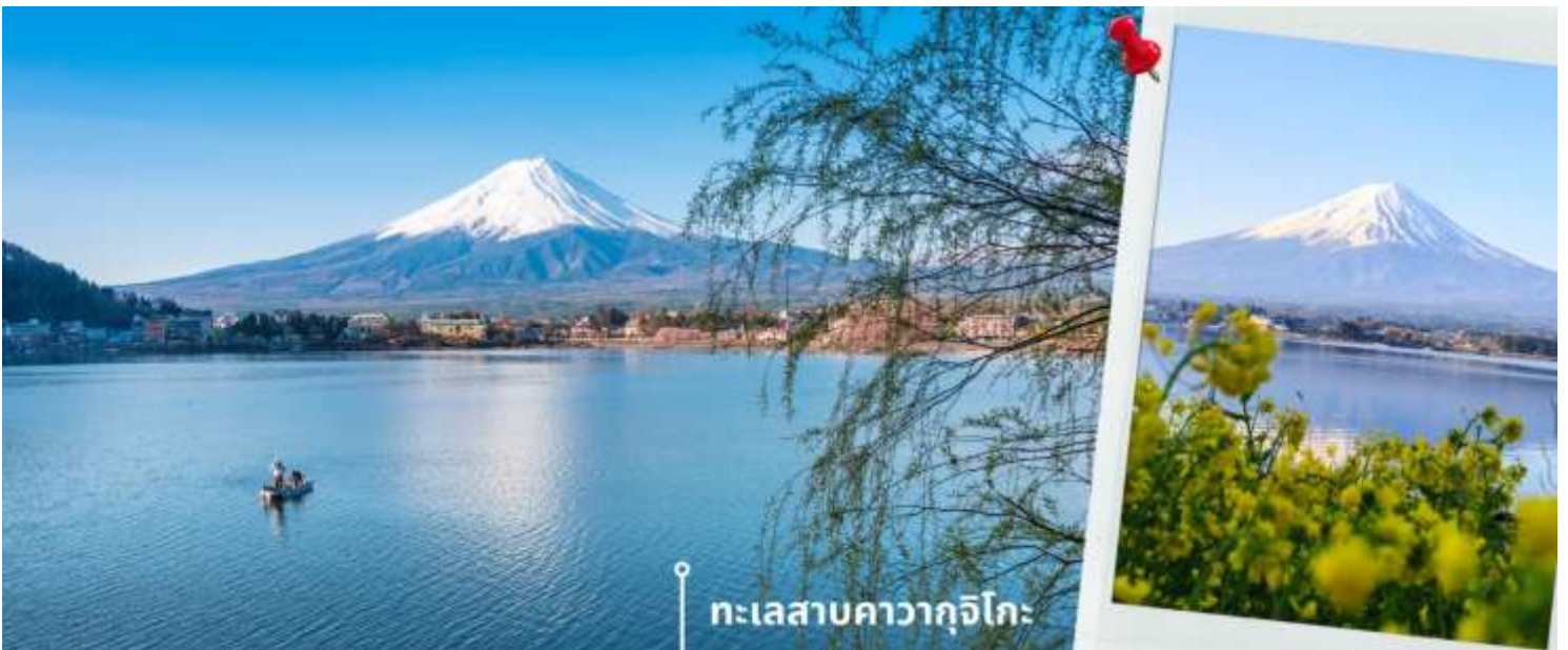
*ดอกไม้จะปรับเปลี่ยนตามฤดูกาล // การมองเห็นภูเขาไฟฟูจิขึ้นอยู่กับสภาพอากาศ*

หลังรับประทานอาหารเที่ยง นำท่านเดินทางสู่ ทะเลสาบคาวากูจิโกะ (Lake Kawaguchiko) ในจังหวัดยามานาชิ แหล่งท่องเที่ยวที่อยู่ไม่ไกลจากโตเกียว (Tokyo) หนึ่งในที่เที่ยวยอดนิยมตลอดกาล ทะเลสาบที่กว้างใหญ่เป็นอันดับ 2 ของ 5 ทะเลสาบรอบภูเขาไฟฟูจิ อยู่บริเวณเชิงภูเขาไฟ ความสูงกว่าระดับน้ำทะเลประมาณ 800 เมตร ทำให้สภาพอากาศบริเวณนี้เย็นสบายตลอดปี รายล้อมไปด้วยธรรมชาติที่อุดมสมบูรณ์ และทิวทัศน์ที่สวยงามตลอดปี สามารถชมวิวดูทั้งทะเลสาบและภูเขาไฟฟูจิได้อย่างชัดเจนในวันที่ฟ้าเปิด จากนั้นเดินทางต่อไปยัง สวนโออิชิ พาร์ค (Oishi Park) เป็นสวนสาธารณะริมทะเลสาบคาวากูจิโกะ เป็นจุดชมวิวยอดนิยมที่ได้รับความนิยมอย่างมาก เป็นจุดชมดอกไม้ที่ปรับเปลี่ยนไปตามฤดูกาล สายพันธุ์และทัศนียภาพอันสวยงามตัดกับภูเขาไฟฟูจิที่ตั้งตระหง่านอยู่เบื้องหลัง ในวันที่ฟ้าเปิด ยังเป็นจุดชมวิวที่สามารถเห็นวิวภูเขาไฟฟูจิได้ ให้ท่านได้เก็บภาพความสวยงามตามอัธยาศัย