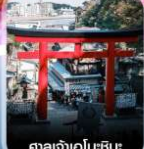
กาลเจ้าเอโนะชิมะ