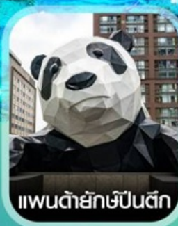
แพนด้ายักษ์ปิ่นตีก