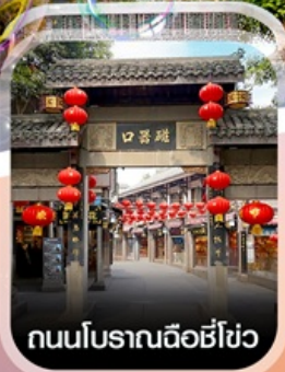
ถนนโบราณฉือชี่โฮ่ว

✈️ คอนเฟิร์มออกเดินทาง ทุกพีเรียด 2 ท่านขึ้นไป