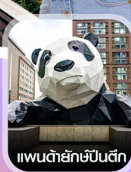
แพนด้ายักษ์ป็นตึก