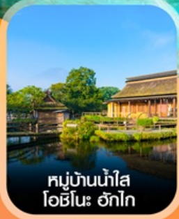
หมู่บ้านน้ำใส โอชิโนะ อักไก