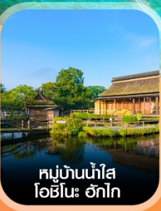
หมู่บ้านน้ำใส โอชิโนะ ฮักไก

✈️ คอนเฟิร์ม ออกเดินทาง ทุกพีเรียด 2 ท่านขึ้นไป