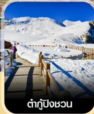
ต้ากู่ปิงชวน