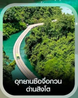
อุทยานชื่อจ้อกวน ด่านสิงโต

สัมผัสมหัศจรรย์ ถ้ำหลงหลินกง ธารน้ำสีมรกตใสราวกระจก แกรนด์แคนยอนผิงชาน ล่องเรือชมธรรมชาติ แกรนด์แคนยอนซิงเจี๋ย