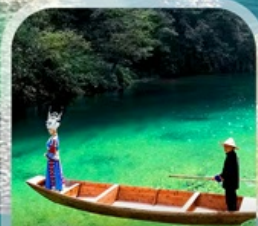
แกรนด์แคนยอนผิงชาน

✈️ คอนเฟิร์มออกเดินทาง ✈️ ทุกพีเรียด 2 ท่านขึ้นไป