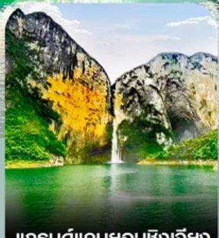
แกรนด์แคนยอนซิงเจี๋ย