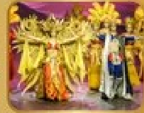
ชมการแสดงละครจีน