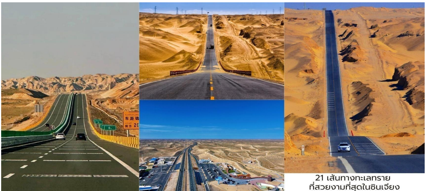
21 เส้นทางทะเลทราย ที่สวยงามที่สุดในซินเจียง

เช้า บริการอาหารเช้า ณ ห้องอาหารของโรงแรม