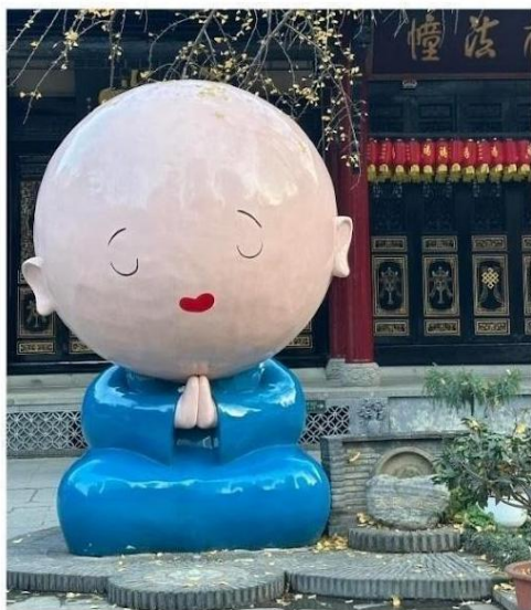
วัดต้าจื่อ

นำท่านสู่ ถนนคนเดินไท่กู๋หลี่ สัมผัสบรรยากาศแหล่งช้อปปิ้งสุดหรูที่ผสมผสานสถาปัตยกรรมแบบวัดโบราณกับตึกสมัยใหม่ได้อย่างลงตัว