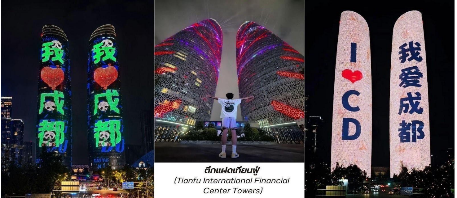
ตึกแฝดเทียนฟู (Tianfu International Financial Center Towers)

จากนั้นพาท่านไป ช้อปปิ้งที่ห้างหรู SKP แลนด์มาร์คที่ล้ำสมัยที่สุดในเมืองเฉิงตูเวลานี้ ห้างสรรพสินค้าลึกลับที่มิได้แค่ขายของแบรนด์เนมแต่คือการปฏิวัติวงการสถาปัตยกรรมด้วยคอนเซ็ปต์สวนสาธารณะบนดิน ห้างหรูใต้ดิน" บนพื้นที่รวมกว่า 5 แสนตารางเมตร ความพิเศษที่ทำให้ Chengdu SKP แตกต่างจากที่อื่นคือการสร้างห้างลึกลงไปใต้ดินถึง 5 ชั้น โดยที่พื้นที่ระดับพื้นดินถูกเปลี่ยนเป็นสวนสาธารณะสีเขียวขนาดใหญ่