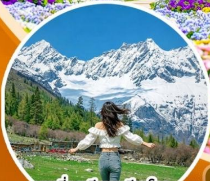
ภูเขาสิดรุณี ช่วงเดียวโกว (รวมรถอุทยาน)

สวนสวรรค์แห่งดอกไม้ MANHUA-จงซูเก๋อ-จัดรู้อย่างเทียนวู-รูปปั้นแพนด้าเซลล์ เมืองโบราณกวนเซี่ยน-อุทยานเขาสีดรุณี(รวมรถอุทยาน)-สะพานหนานเจียว เมืองลั่วใต้-ตึกแฝด-SKP-วัดต้าจื่อ-ถนนคนเดินซุนซีลู่-IFS-ตงเจียวจี้-ถนนคนเดินไท่กุหลี่