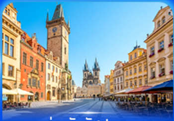
ย่านจัตุรัสปราก