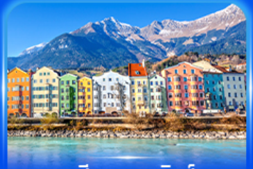
อาคารสีลูกกวาด อินส์บรุค