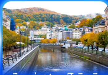
เมืองแห่งสปา คาร์โลวารี