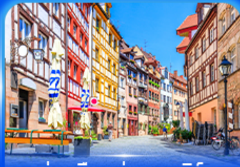
ย่านเมืองเก่า บูเรมเบิร์ก