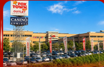
ฟ็อกซ์ทาวน์ เฉาก์เล็ก