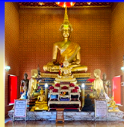
วัดทองคิง