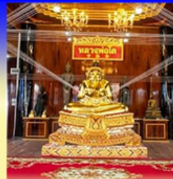
วัดเกษมสรณาราม