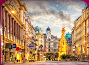
ชมเมืองโรมันติก เวียนนา