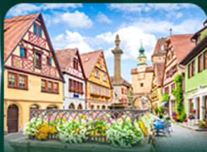
โรเรนเบิร์ก ออบ เดียร์ เทาเบอว์