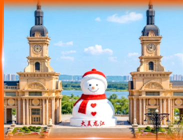
ตุ๊กตาหิมะยักษ์ ฮาร์บิน