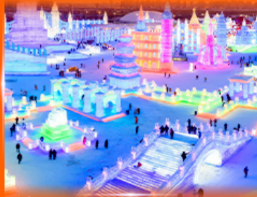
เที่ยว ICE & SNOW WORLD