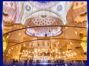
เข้าชมความงามสุเหร่าสีน้ำเงิน