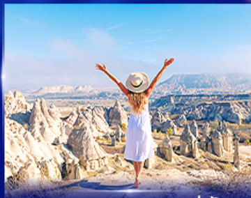
ชมความงดงาม หุบเขาแห่งรัก