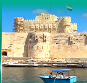
ปิ่อมปรการ Quite Bay