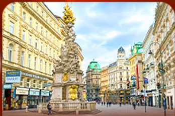
คาร์ทีเนอร์ สตรีท ออสเตรีย