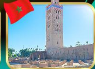
มัสยิดคูตูเบีย มาราเกช