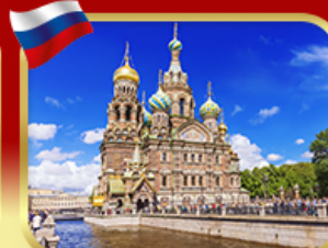
เข็ลคินโบสกแห่งหยดเลือด