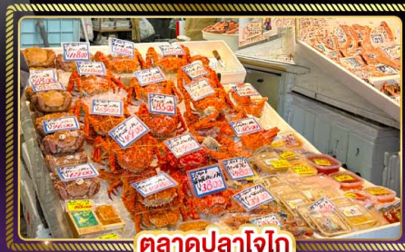
ตลาดปลาโอ