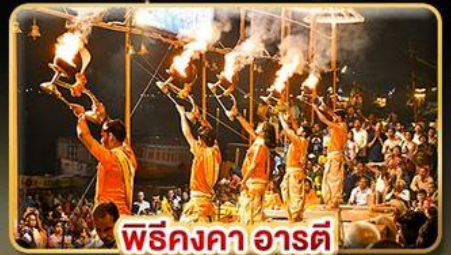
พิธีคองคา อารตี