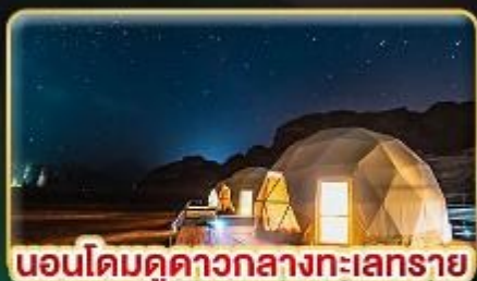
นอนโดมคูดาวกลางทะเลทราย

★ บินตรงสู่ "จอร์แดน" เยือน 7 มหัศจรรย์ของโลก