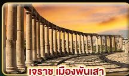
เอรราช เมืองพันเสา