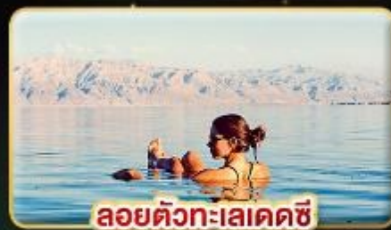
ลอยตัวทะเลเดดซี