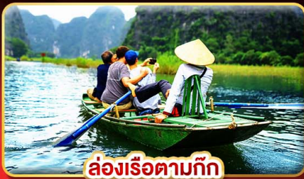
ล่องเรือตามก๊ิก